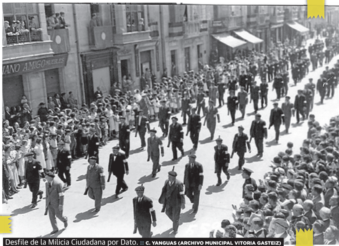
Desfile de la Milicia Ciudadana por Dato.