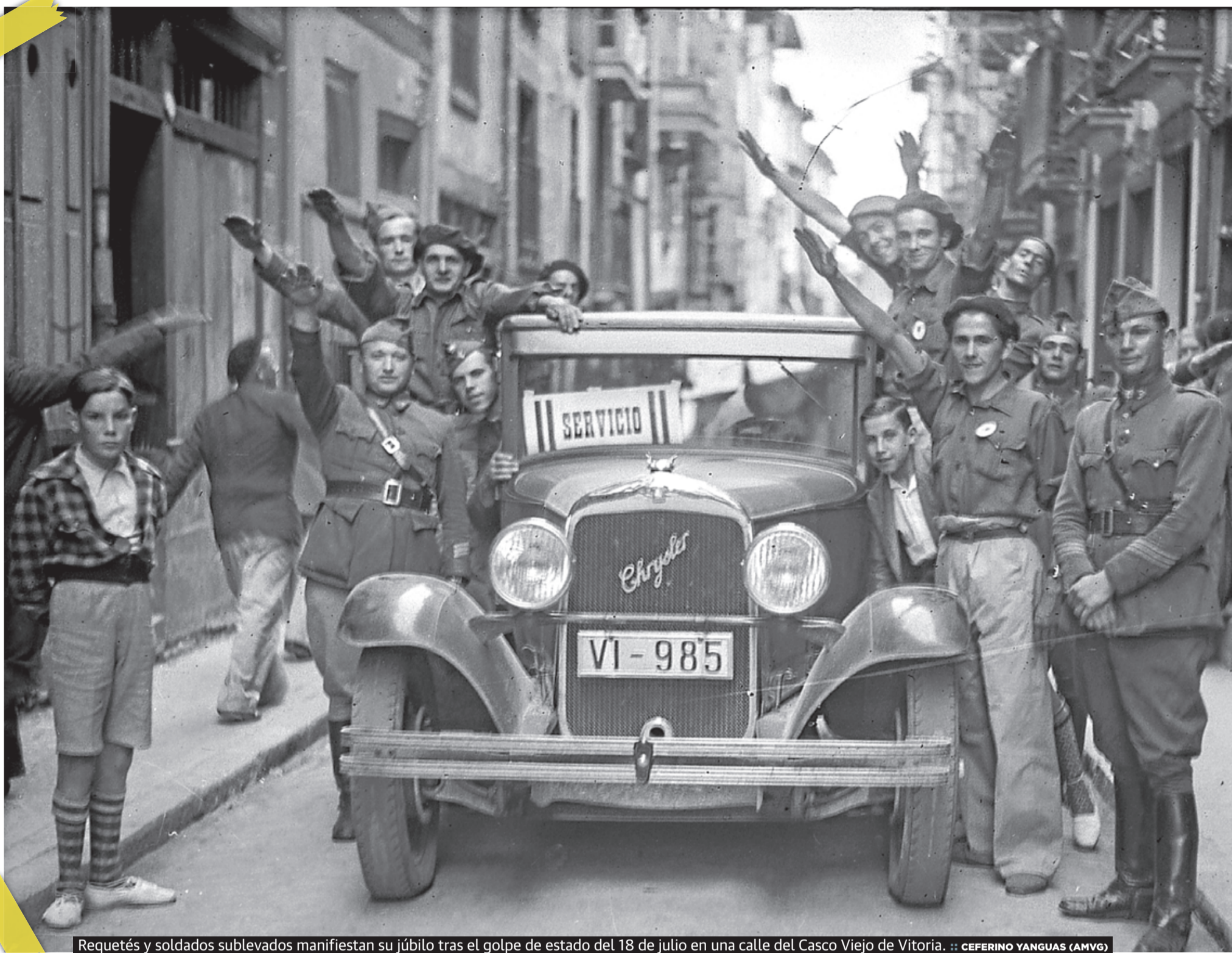
Requetés y soldados sublevados manifiestan su júbilo tras el golpe de estado del 18 de julio en una calle del Casco Viejo de Vitoria.