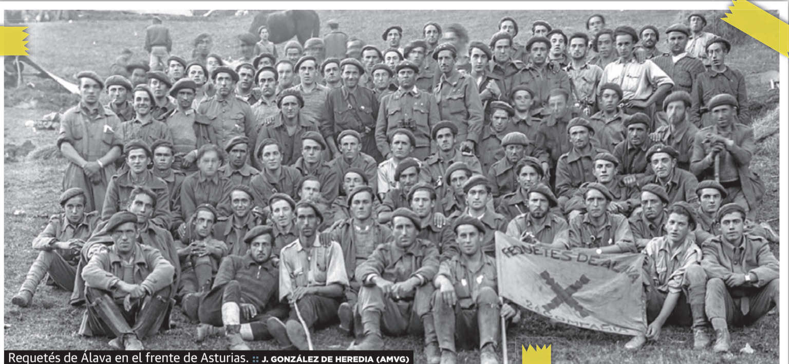
Requetés de Álava en el frente de Asturias.