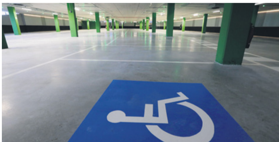
Planta -2 para personas abonadas

o bien haber adquirido en un plazo menor de un año desde dicha fecha una vivienda dentro de la zona de influencia, en la que permanezcan debidamente empadronadas. Es requisito imprescindible tener permiso de conducir en vigor.